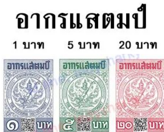
ภาพที่ 1 ภาพตัวอย่างอากรแสตมป์

“อากรแสตมป์” หาซื้อได้จากสำนักงานสรรพากรเขตหรืออำเภอต่าง ๆ และสำนักงานสรรพากรจังหวัด ซึ่งเป็นหน่วยงานของทางราชการ หรือตัวแทนจำหน่ายซึ่งเป็นภาคเอกชนก็ได้ ปัจจุบัน “อากรแสตมป์” มีราคาตั้งแต่ 1 บาท ถึง 20 บาท ตามตัวอย่าง