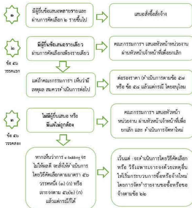
ภาพ สรุปรายงานผลการประกวดราคาอิเล็กทรอนิกส์

เว้นแต่ หน่วยงานจะดำเนินการซื้อหรือจ้างโดยวิธีคัดเลือกหรือวิธีเฉพาะเจาะจงด้วยเหตุอื่นให้เริ่มกระบวนการซื้อหรือจ้างใหม่