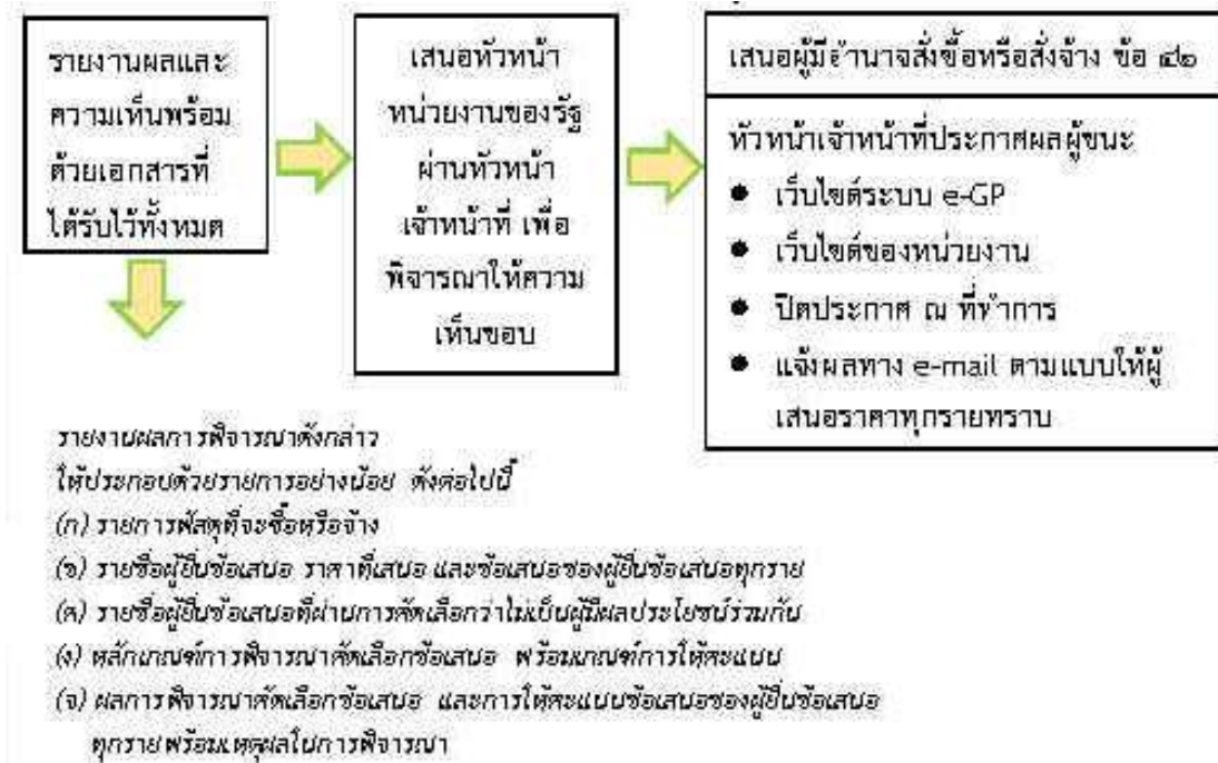
ภาพ 6 รายงานผลการประกวดราคาอิเล็กทรอนิกส์

เมื่อพิจารณาผลการประกวดราคาแล้ว ปรากฏว่า มีผู้ยื่นข้อเสนอหลายรายแต่ถูกต้องตรงตามเงื่อนไขที่กำหนดในเอกสารประกวดราคาอิเล็กทรอนิกส์เพียงรายเดียว ให้เสนอหัวหน้าส่วนราชการผ่านหัวหน้าเจ้าหน้าที่พัสดุเพื่อยกเลิกการประกวดราคาอิเล็กทรอนิกส์ครั้งนั้น แต่ถ้าคณะกรรมการพิจารณาผล