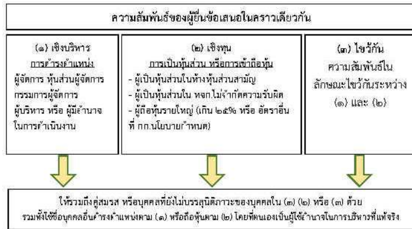
ภาพ 4 การมีส่วนได้ส่วนเสียทั้งทางตรงและทางอ้อม